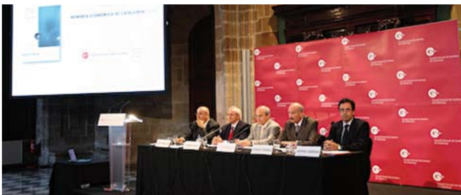
Otra imagen del acto de presentación de la memoria

“La superación de la crisis actual y el diseño de un nuevo modelo económico de futuro para el Principado exigen establecer prioridades y estrategias que permitan reforzar los puntos fuertes de nuestro tejido productivo”